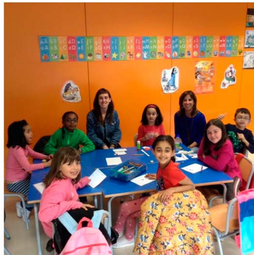
Figura 6. El grupo de niños y niñas junto a la Profesora A y la investigadora de la universidad.

Sin embargo, en el grupo de niños y niñas su implicación ha sido mayor llegando a realizar un vídeo por parte de los profesionales de Candela Radio en una sesión de este grupo entrevistando a sus protagonistas tanto al alumnado como a la profesora A, del cual se edita un vídeo corto de 6:47 minutos que se decide presentar en el programa en directo. A su vez, se va decidiendo quiénes van a ser las personas representantes para ser entrevistadas, el título del bloque (“Cambia el chip y habla en euskara”) y la música (La canción de “Korrika 2019”) que se va a utilizar para dar paso a otro bloque y se aprovechan las salidas de las sesiones en las que están familiares para comentar diversas cuestiones. Por ejemplo, se consigue la confirmación de una madre de Barcelona que está estudiando euskara para ser entrevistada en el programa en directo.