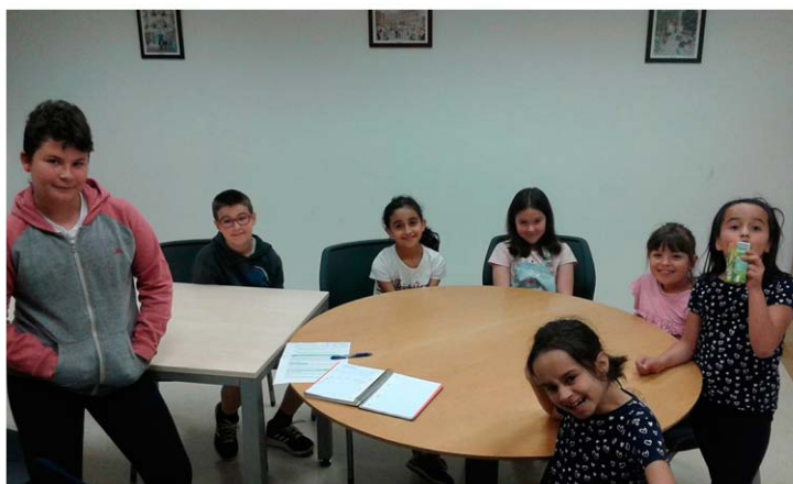
Figura 9. Sesión de evaluación posterior al programa de radio.

Los que estuvimos como oyentes exclusivamente disfrutamos. Yo creo que esto y la invitación también a vosotras al plan de innovación ha generado que se pueda poner en marcha una emisora de radio en el municipio a través de Internet aunque sea que pueda generar contenidos estables durante tiempo y que creo que valiéndose de esta experiencia tiene que tener en cuenta estos colectivos que igual necesitan una inclusión o un trato especial o que de alguna manera pueden ser tenidos en cuenta. Es decir, veo una emisora de radio con contenidos estables vinculados a sociedades deportivas, asociaciones culturales... pero también veo un espacio para los niños y niñas que están aprendiendo euskara en el proyecto, veo pues igual a cuidadores y cuidadoras de personas dependientes, proyectando esa emisora como un altavoz a sus vidas (Alcalde, sesión de evaluación del 29 de mayo de 2019).