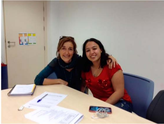
Figura 4. La técnico de euskara y la exalumna marroquí.

La técnico municipal de euskara también se pone en contacto con una exalumna marroquí, tanto del colegio público como del programa de refuerzo de euskara, que actualmente tiene 23 años y se le invita a participar en el proyecto. Como está dispuesta a colaborar se mantienen un par de reuniones con ella, compartiendo que cuando llegó al municipio no sabía castellano y ahora habla castellano, euskara, árabe y francés. De hecho, toda la comunicación que se mantiene con ella se lleva a cabo en euskara. Sin embargo, por incompatibilidad de horarios laborales ha resultado muy difícil que pudiera participar tanto como hubiera querido. No obstante, sí que está presente en alguna sesión de desarrollo del proyecto con el grupo de niños y niñas.