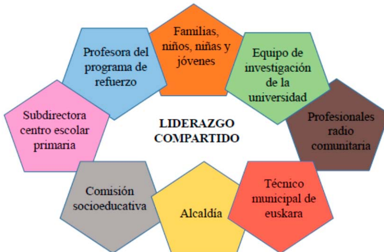
Figura 1. Liderazgo compartido.

El entramado organizativo que ha supuesto la puesta en marcha del programa de radio comunitaria y, en concreto, del bloque al que nos estamos refiriendo ha sido muy complejo. La siguiente figura muestra los agentes que han participado en la organización de este bloque, que se ha basado en un liderazgo compartido: