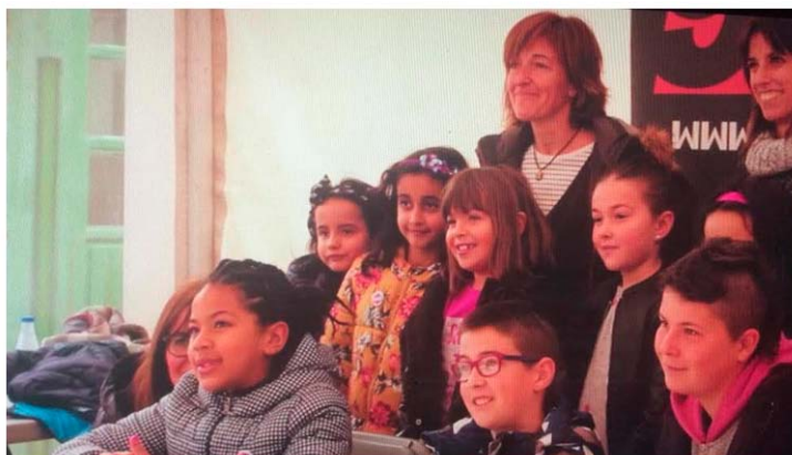
Figura 8. Participantes del bloque 4 en el programa de radio en directo.

cia con un idioma diferente al suyo. Los jóvenes entrevistador y entrevistadora iban dando la entrada, preguntaban y cerraban la entrevista, dando paso a su vez al vídeo editado en el grupo de niños y niñas.