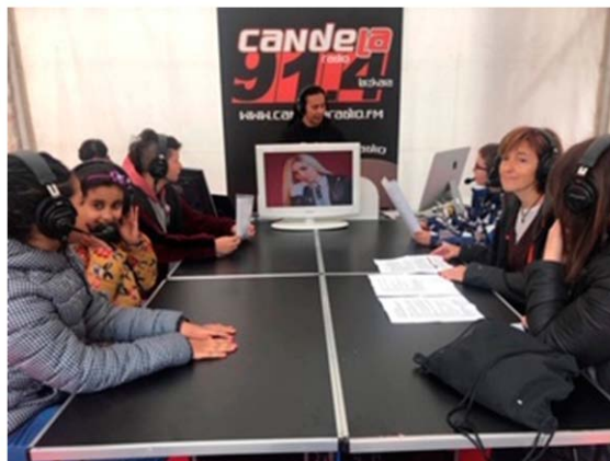
Figura 7. La mesa de emisión del bloque en directo.

El montaje...cuando por la mañana ya me dijeron no pero si llevan cuatro horas montando desde las 6:00 de la mañana, menudo montaje que hay aquí (Técnico municipal de euskara, sesión de evaluación del 29 de mayo de 2019).