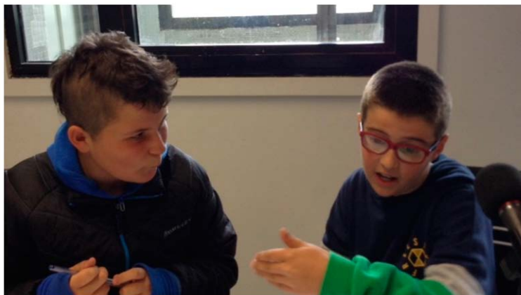
Figura 2. Joven 1 y joven 2 en el ensayo general.

Además, en todo este proceso ha resultado destacable la labor fundamental de la subdirectora del colegio público del municipio, quien también es miembro de la Comisión Socioeducativa, como una de las personas relevantes que han facilitado además de los espacios para las reuniones, todas aquellas gestiones necesarias para contactar con las familias y el alumnado.