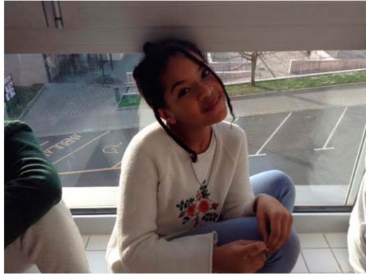
Figura 5. Una alumna del grupo jóvenes.